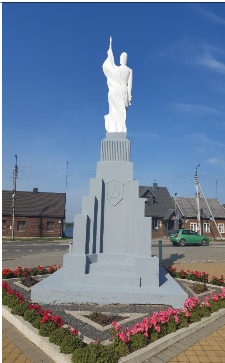
Kultūros vērtības kods 2095